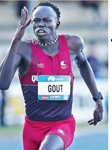
నాడు. అందరి 16 విభాగంలో 100, 200 మీటర్లలో పలు రికార్డులు నెలకొల్పాడు. 15 ఏళ్ల వయసులో గాట్.. అందరి 18 విభాగంలో 200 మీటర్ల రేసును 20.87 సెకన్లలో పూర్తి చేసి దేశ వాటిలో రికార్డు నెలకొల్పాడు. అంతర్జాతీయ అథ్లెటిక్స్ బోర్డులోనూ సత్త వాటిని గాట్ ఓడి నియా అందరి 18 అథ్లెటిక్స్ ఛాంపియన్షిప్ లో 200 మీటర్లు, 4400 మీటర్ల రెలేలో స్వల్ప వతకాలు వైవం చేసుకున్నాడు.