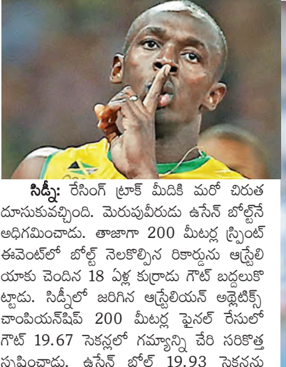
సిద్ది: రేసెంగ్ క్రాక్ మీడికి మరో చిరుత దూసుకువచ్చింది. మెరుపుమీద ఉన్న బోల్స్ ను అధిగమించాడు. తాజాగా 200 మీటర్ల స్పెర్డ్ లో ఈ ఎండ్లో బోల్స్ నెలకొల్పిన రికార్డును ఆస్ట్రేలియాకు చెందిన 18 ఏళ్ల కుర్రాడు గాట్ బద్దలుకొట్టాడు. సిద్దిలో జరిగిన ఆస్ట్రేలియన్ అథ్లెటిక్స్ ఛాంపియన్షిప్ 200 మీటర్ల పైనల్ రేసులో గాట్ 19.67 సెకన్లలో గమ్యాన్ని చేరి సరికొత్త స్వప్తింపాడు. ఉన్న బోల్స్ 19.93 సెకన్లను టైమింగ్ ను ట్రెక్ చేశాడు. గతంలో గాట్ ఇదే 200 మీటర్ల రేసును 20.02 సెకన్లలో పూర్తి చేశాడు. తాజాగా తన రికార్డును మరింత సవరించడమే గాకుండా ఏకంగా బోల్స్ రికార్డుకు ఎన్నడూ పెట్టిన నయా చిరుతగా ఆవిరయ్యాడు.