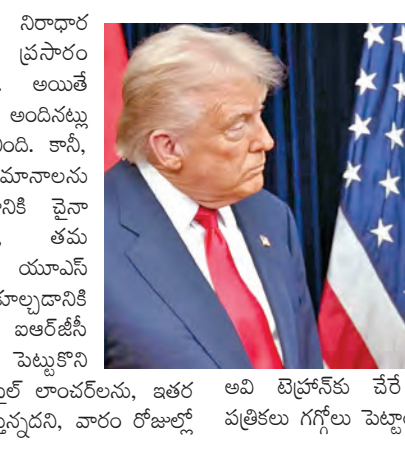
అవి టెక్నోసోఫ్ చేరే అవకాశం ఉందని అమెరికా పత్రికలు గగ్గోలు పెట్టాయి.

మీడియా సంస్థలు తమపై నిరంధార ఆరోపణలతో కథనాలు ప్రసారం చేస్తున్నాయని విమర్శించింది. అయితే చైనా నుంచి ఆయుధాలు అందినట్లు ఇరాన్ బహిరంగంగా వెల్లడించింది. కానీ, తాము అమెరికా విమానాలను విజయవంతంగా కూల్చి దానికి చైనా ఆయుధాలను వాడలేదని, తమ అధినాతన రక్షణ వ్యవస్థలే యూఎస్ విమానాలను కూల్చడానికి ఉపయోగపడ్డాయని ఇవార్టీసీ వెల్లడించింది.భుజం మీద పెట్టుకొని ప్రయోగించే పార్టీ రేజిల్ మిస్సైల్ లాంచర్లను, ఇతర క్షిపణి వ్యవస్థలను సరఫరాచేస్తున్నదని, వారం రోజుల్లో